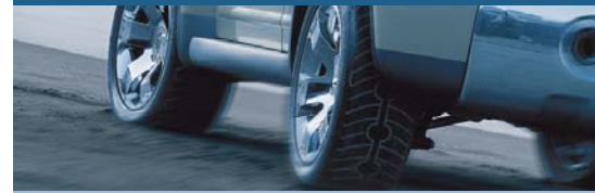
Alineación de direcciones FWA