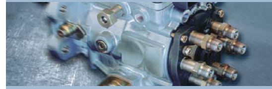
Comprobación de componentes EPS