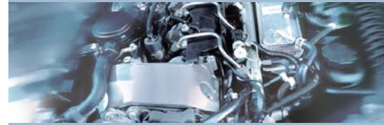
Análisis de sistemas de vehículo FSA