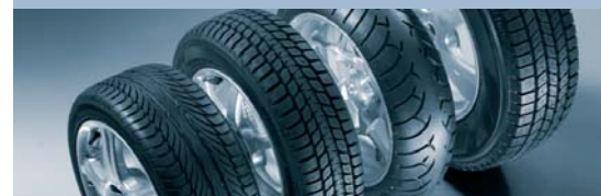
Equipos para el servicio de neumáticos TSE