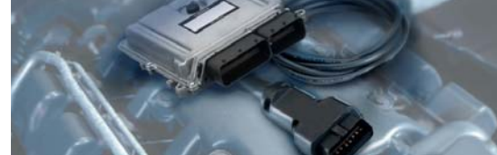
Diagnóstico de unidades de mando KTS