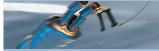
Análisis de emisiones BEA