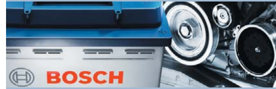
Equipos para el servicio de baterías BAT